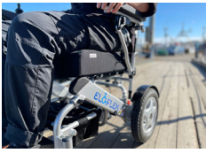
Ease tryckavlastande kudde